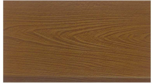
DF-M6204 (ชนิดด้าน) สีไม้วอลนัท