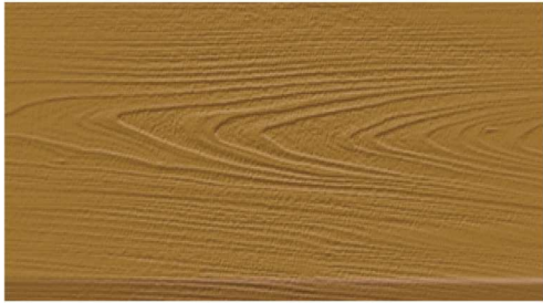
DF-M6202 (ชนิดด้าน) สีไม้สัก

Beger WoodStain Decking Fiber Cement ใช้นวัตกรรมใหม่ล่าสุด Super Resin Technology ทำให้เนื้อสีซึมลึกถึงเนื้อไฟเบอร์ซีเมนต์ ฟิล์มสีจึงยึดเกาะดี ไม่หลุดล่อน และให้การทนทานต่อการเหยียบย่ำ ชัดช่วน และสภาวะอากาศได้เป็นอย่างดี เหมาะสำหรับงานพื้นภายใน และภายนอกทุกประเภท ใช้งานง่าย แห้งเร็ว ไม่มีส่วนผสมของสารปรอท และตะกั่ว จึงมั่นใจได้ในความปลอดภัย