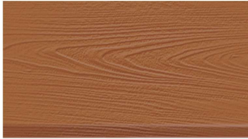
DF-M6201 (ชนิดด้าน) สีไม้มะฮอกกานี