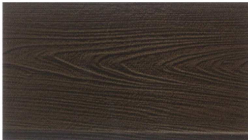
DF-M6203 (ชนิดด้าน) สีไม้โอ๊ค