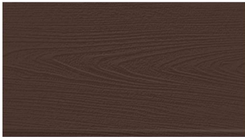
DF-M6206 (ชนิดด้าน) สีไม้แดง