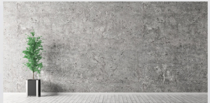
ผนังซีเมนต์

*ห้ามใช้กับกระเบื้องเซรามิก และแกรนิตโต้