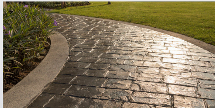
คอนกรีตสแตมป์