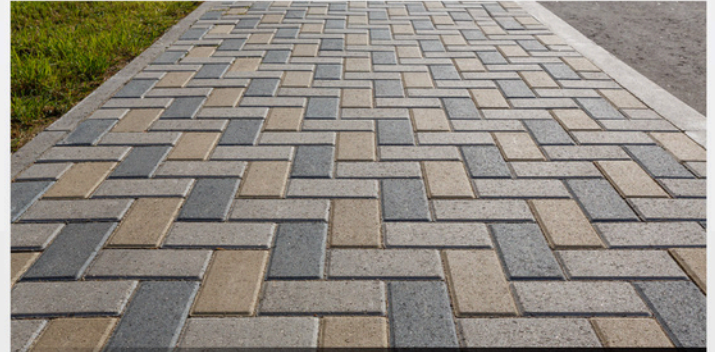
บล็อกตัวหนอน