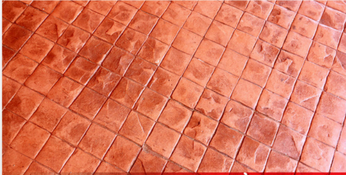
กระเบื้องดินเผา*