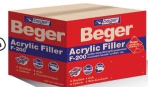
300 g. x 12 Unit / 1kg. x 12 Unit / 4kg. x 4 Unit