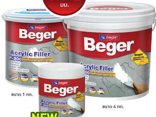
ขนาด 1 กก.