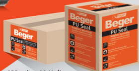
600 ml. x 12 Unit