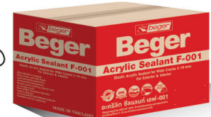
1kg. x 12 Unit / 4kg. x 4 Unit