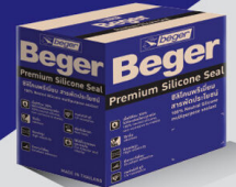
280 ml. x 12 Unit