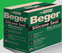
280 ml. x 12 Unit