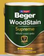
ชนิดเคลือบใส