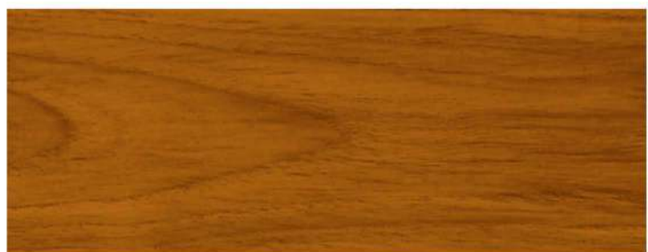
สีไม้สักทองพม่า / Burmese Golden Teak