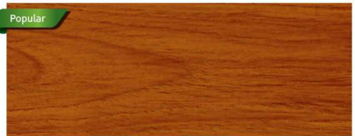
สีไม้มะฮอกกานี / Mahogany