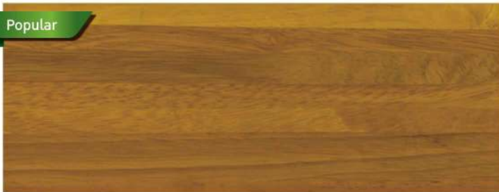
สีใสเงา / Clear Gloss