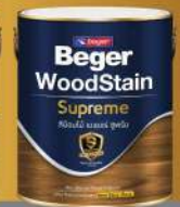
ชนิดกึ่งมา