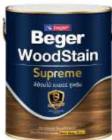
ชนิดทึบมา