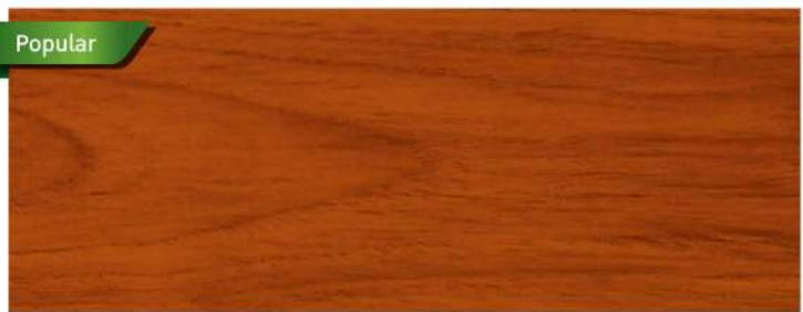
สีไม้สัก / Teak