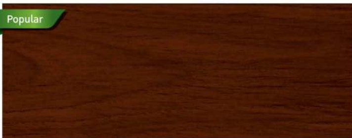
สีไม้วอลนัท / Walnut