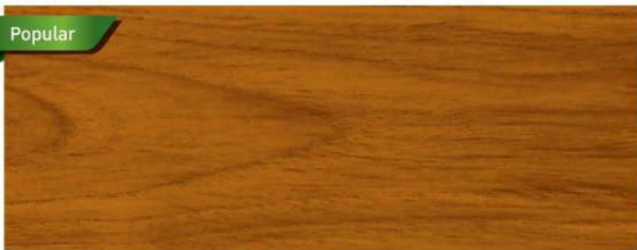
สีไม้สัก / Burmese Teak