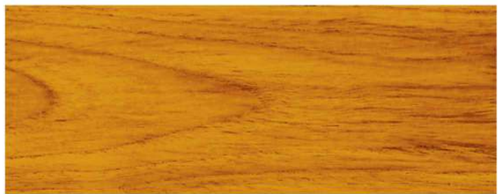
สีไม้สักทอง / Autumn Oak