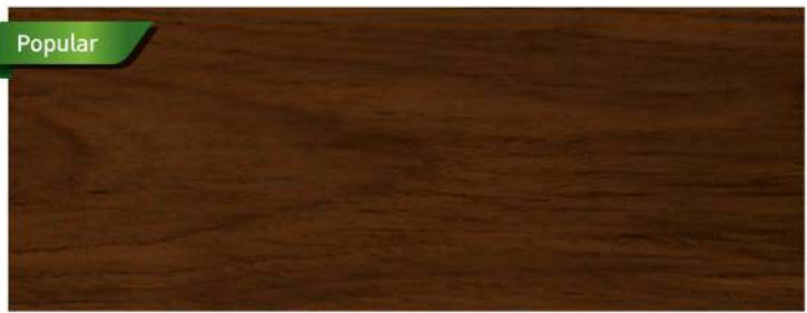
สีไม้ประดู่ / Dark Oak