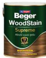
ชนิดเคลือบใส