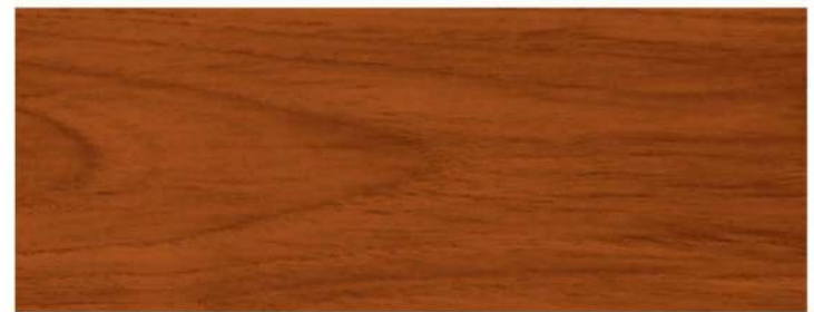
สีไม้มะค่า / Pyinkado