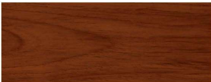
สีไม้แดงพม่า / Myanmar Redwood