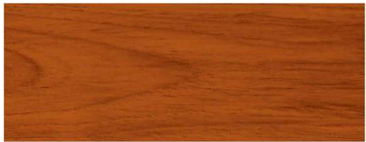
สีไม้แดง / Red Wood